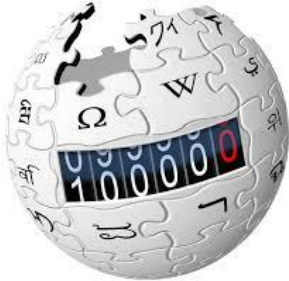
ויקיפדיה העברית חוגגת מאה אלף ערכים